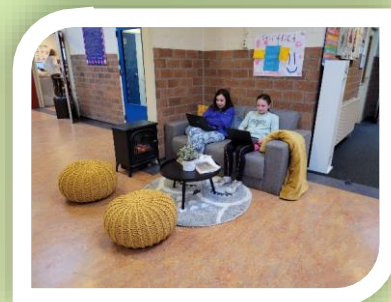
Lekker werkplekje, uitgezocht door de Parelraad