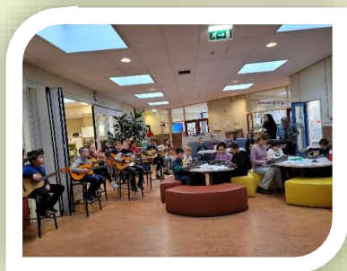
We hebben genoten van de muziek optredens