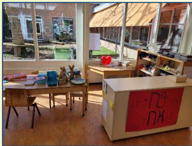
Mooie werkjes bij het atelier.