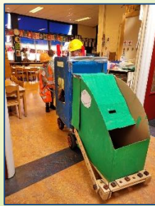
Het thema van Unit 1-2-3 is milieu en recycling.