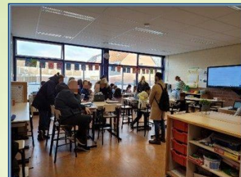
Zo gezellig: ouders bij de inloop.